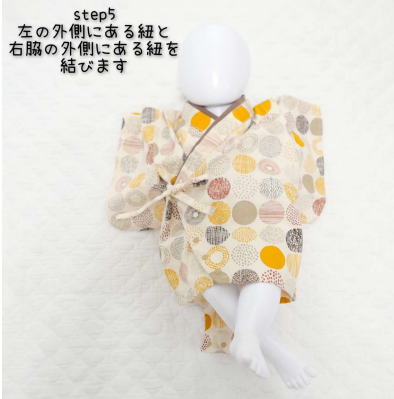
step5 左の外側にある紐と 右脇の外側にある紐を 結びます