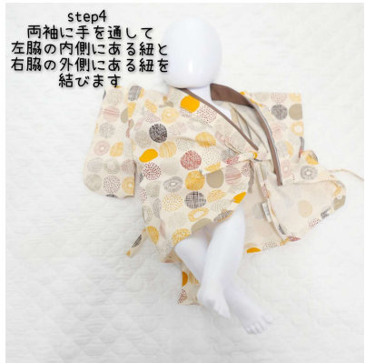
step4 両袖に手を通して 左脇の内側にある紐と 右脇の外側にある紐を 結びます