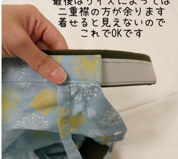
最後はサイズによっては 二重襟の方が余ります 着せると見えないので これでOKです

まっすぐ付けてしまうと着た時に見た目が悪くなるので 着る時の事をイメージしてカーブさせた状態を取り付けてください